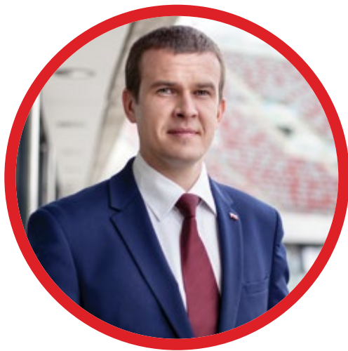
Minister Sportu i Turystyki WITOLD BAŃKA